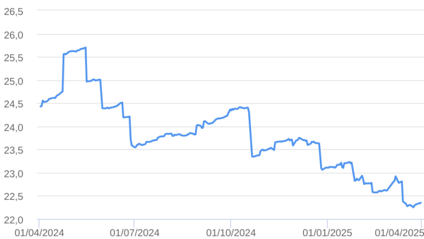
Patrimônio Líquido (R$ Milhões) - 02/04/2024 a 31/03/2025 (diária)